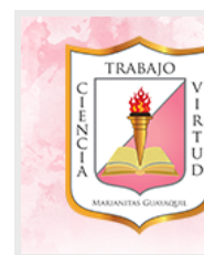
HISTORIA Comunidad Marianita en C...